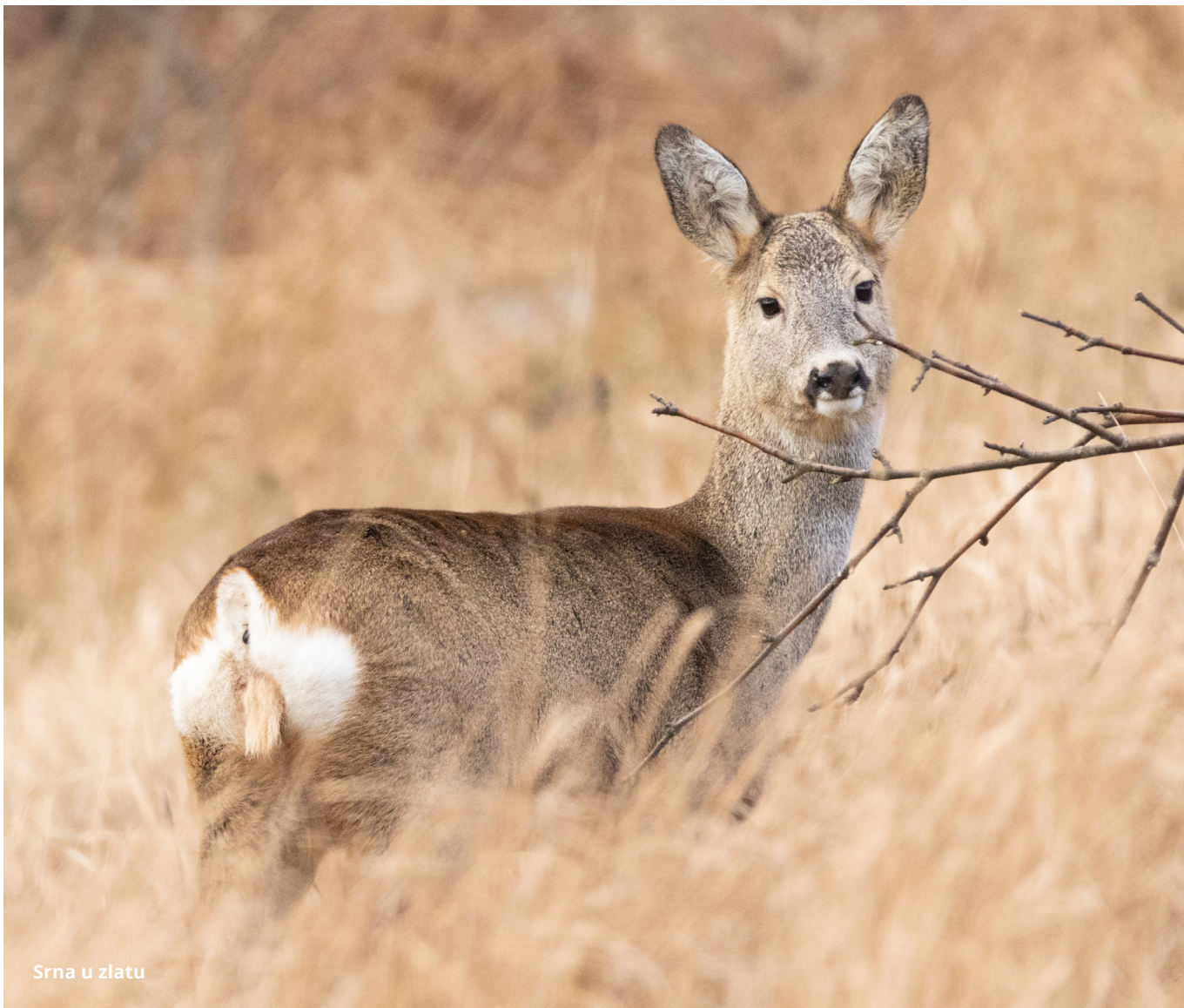
Srna u zlatu