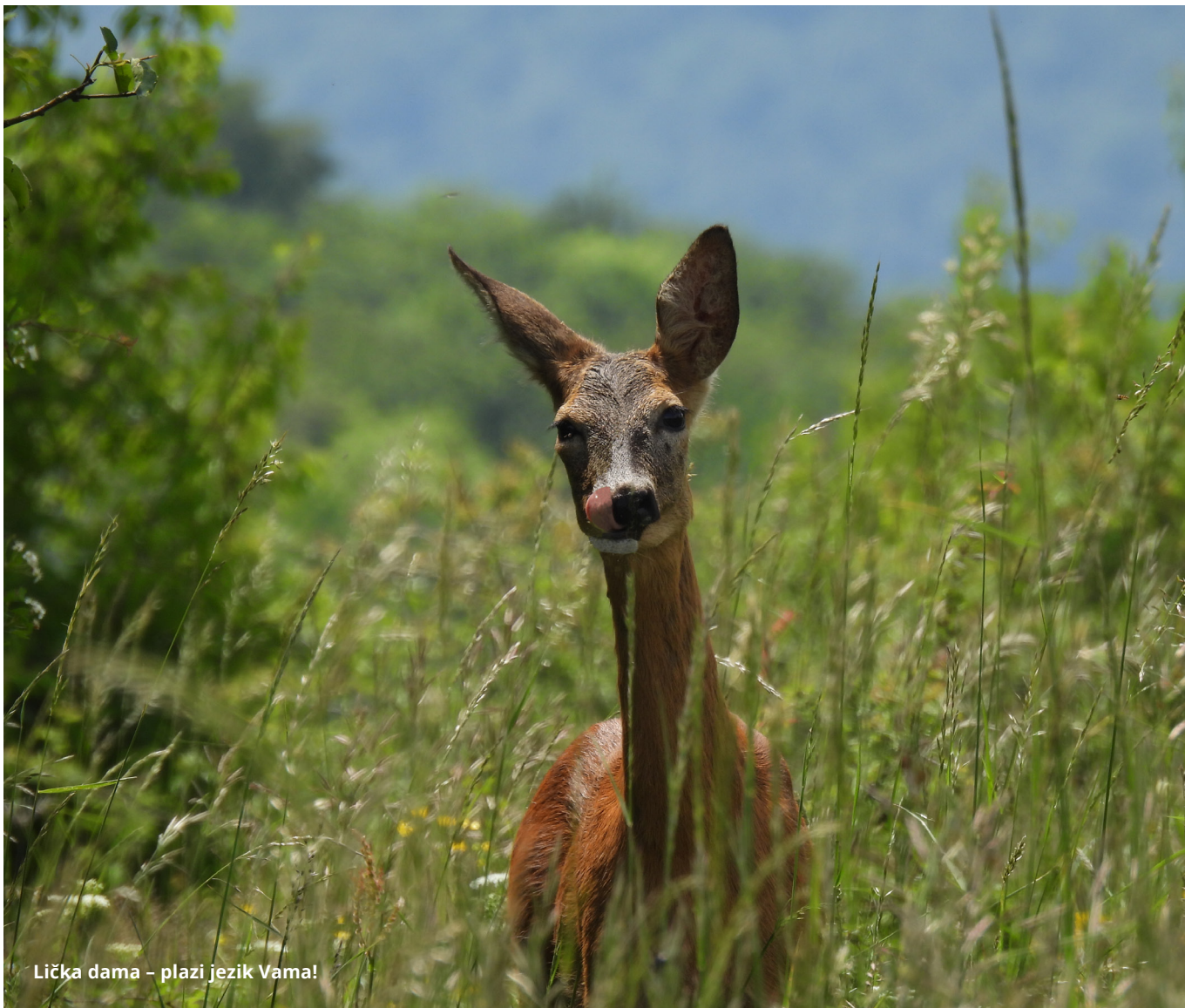
Lička dama – plazi jezik Vama!