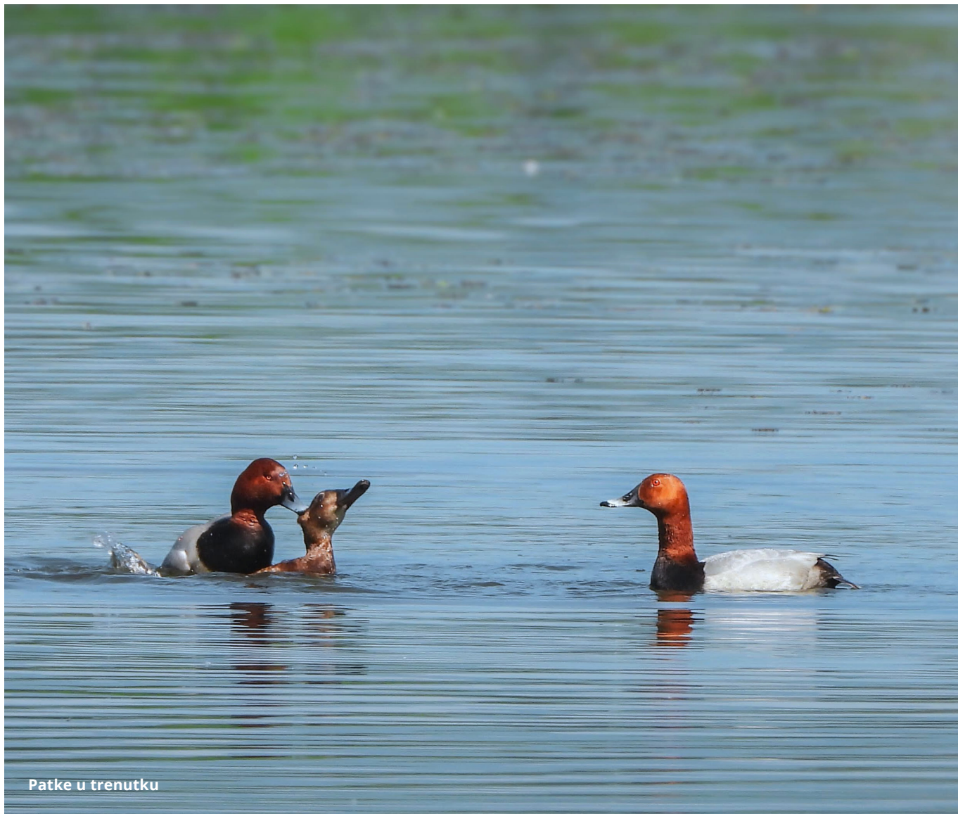
Patke u trenutku