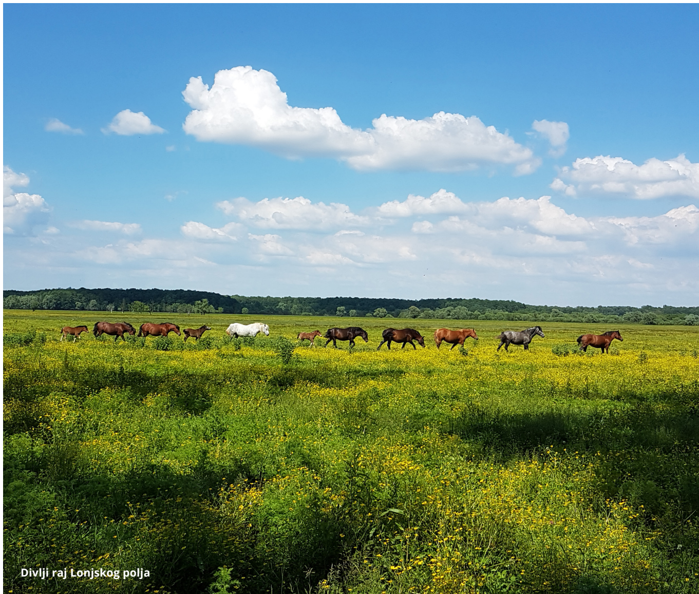
Divlji raj Lonjskog polja