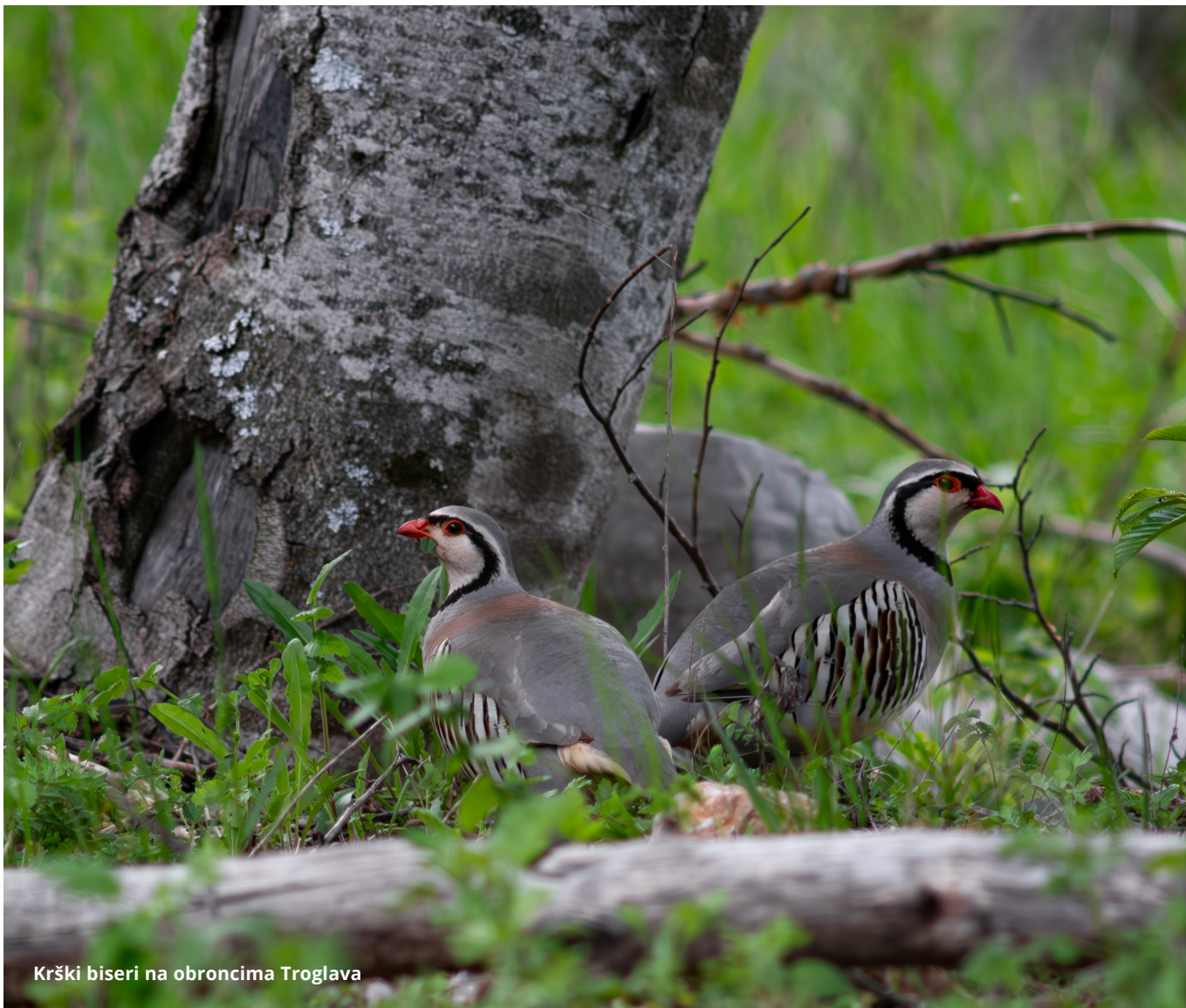
Krški biseri na obroncima Troglava