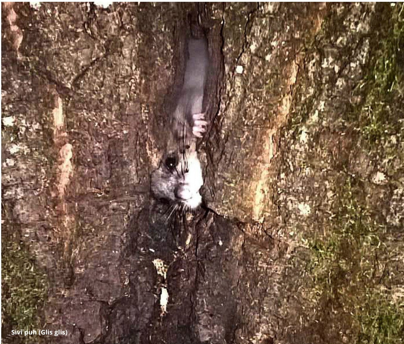
Sivi puh (Glis glis)